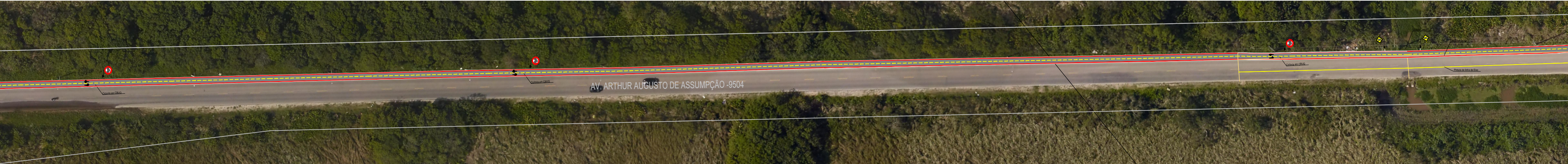
PLANTA BAIXA TRECHO 03 ESC. 1:750