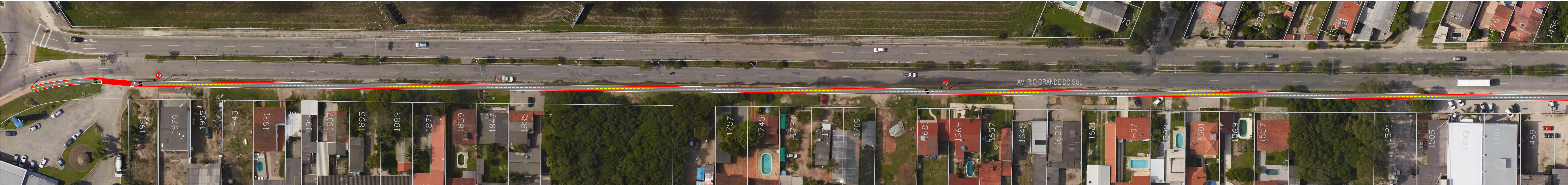
PLANTA BAIXA TRECHO 01 ESC. 1:750